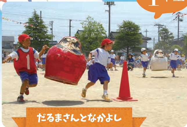
だるまさんとながよし