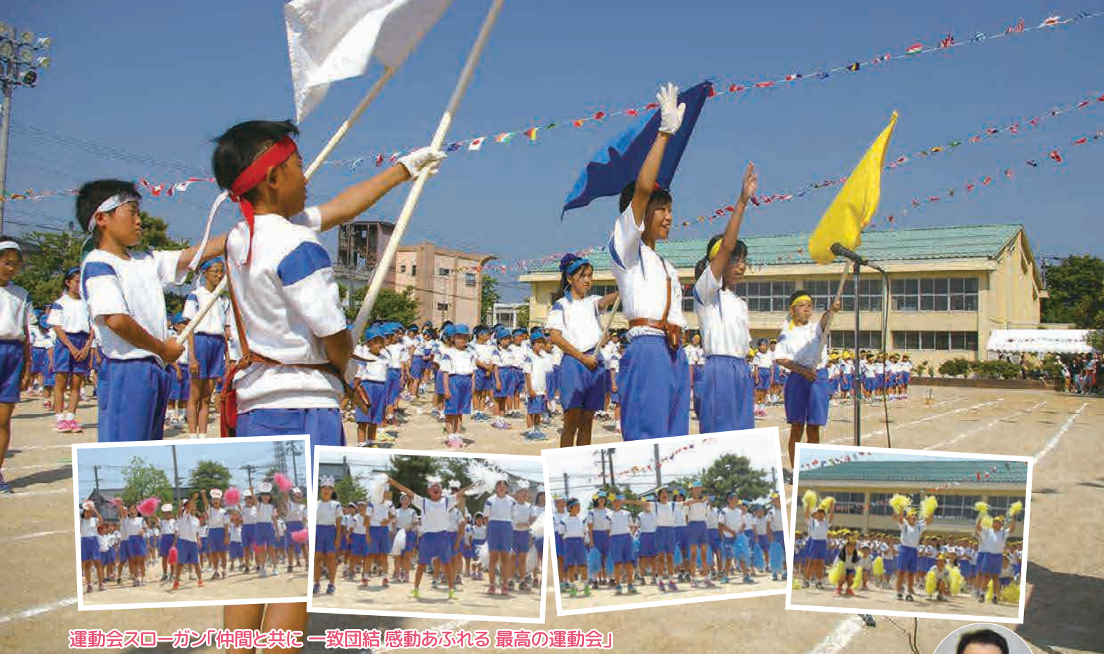
運動会スローガン「仲間と共に 一致団結 感動あふれる 最高の運動会」