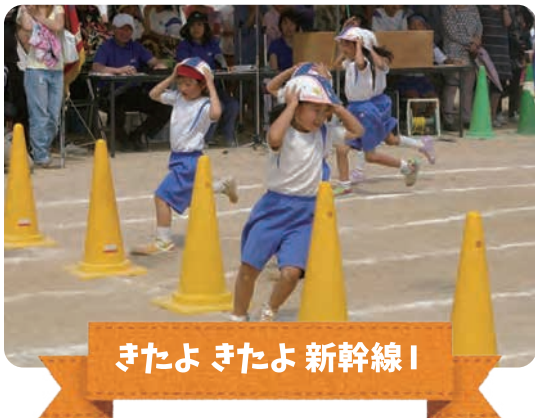
きたよ きたよ 新幹線!