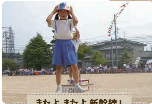
きたよ きたよ 新幹線!