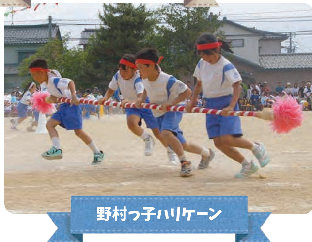
野村っ子ハリケーン