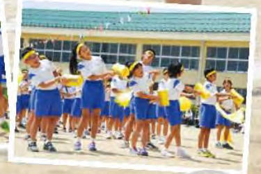
仲間と共に勝利をつかめ 一致団結 運動会 5月24日(土) 運動会