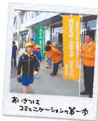
おはようコミュニケーション第一歩

上は自分から挨拶ができる」という目標があります。今年の数値目標は85%と、去年の80%から少し上げました。保護者の方には「挨拶運動のお願い」という書類をお願いをしています。教員も立っており、教頭は毎日野村交差点に立っています。私も日々よって立ったり、歩いたりしています。